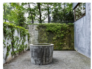
Gartenarchitektur Dieter Kienast