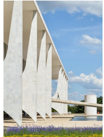
Palácio do Planalto Oscar Niemeyer

Wir wünschen Ihnen viel Erfolg. Juni 2024, die Kurskommission